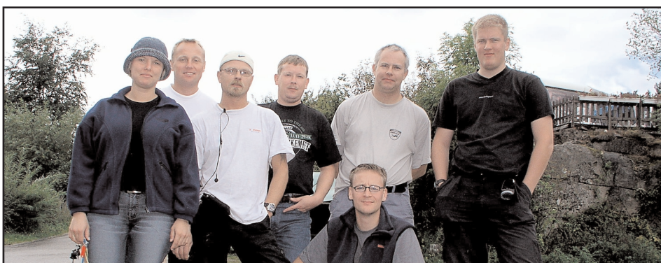
Gruppbild från sektionsresan 29-31 augusti