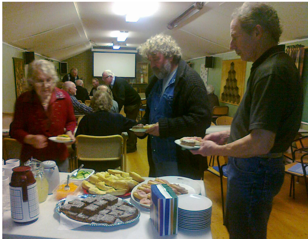
Paus mellan filmerna.

Den nya lampan lyste över parkeringen, så det var lätt att hitta parkeringsplats i mörkret den 4 november.