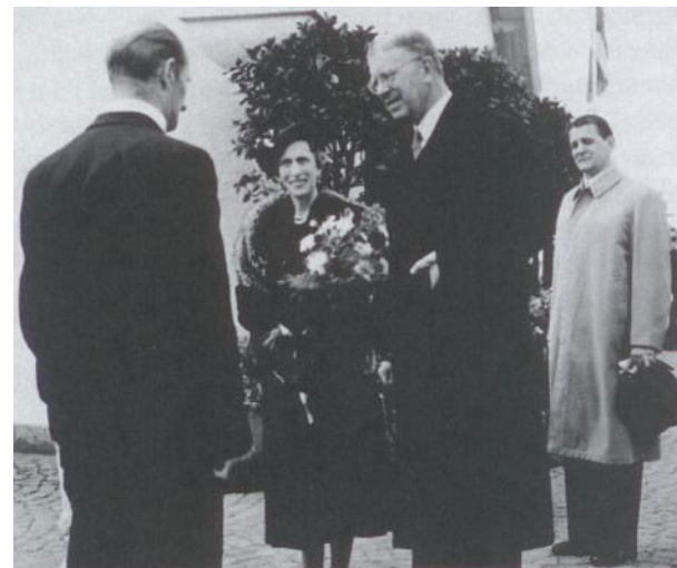
Kungabesöket 1954.

Bland de korta filmsekvenserna syntes bl.a. en lastbil som vält på gamla "Prästabron" över Nossan, siste mjölnaren på kvarnen i Vreta, mid-sommarfirande på Haraberget, fotbollsmatch på Skoghälla och realexamen på 1960-talet.