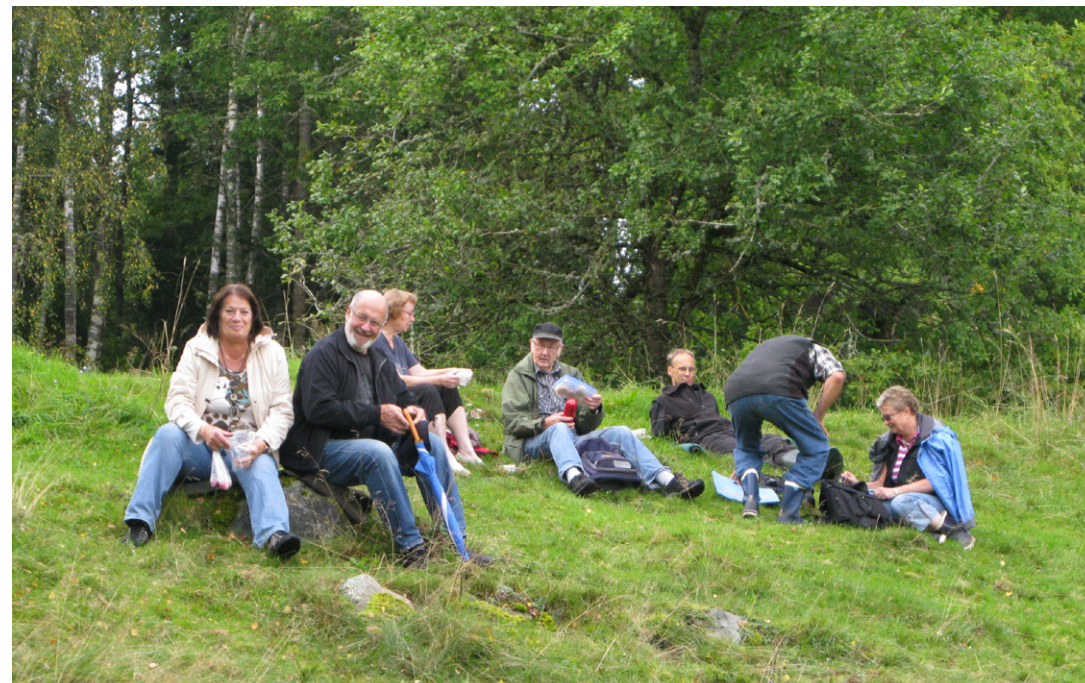
Hagarna ovanför Kyléns passar fint för en kaffepaus i det gröna.

de vi inte se så långt som man gjorde i slutet på 1800-talet, när det var så gott som skoglöst i denna utkant av Svältorna, även om det också fanns gårdar med mindre skogsbestånd.