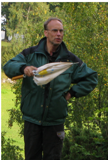
Sune tog paraplyet till hjälp för att understryka sitt resonemang.

Några exempel: Brättensby gamla festplats hette, som de flesta vet, Gröna Berg, och namnet kommer från ett verkligt berg som ligger längre upp i skogen.