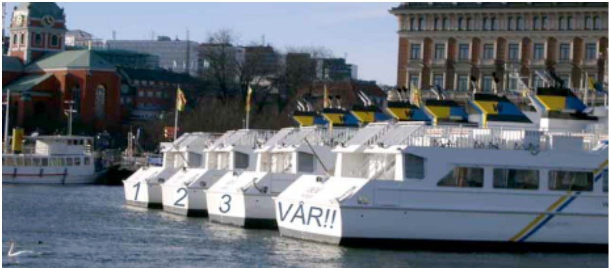
Ett tu tre så blir det vår igen - även om det verkar långt tills dess en snöig dag i mars.

Viggsö och Södra Grinda får ett nytt anlöp med m/s Vånö måndag-torsdag, avgång från Strömkajen kl. 10.00. En timme tidigare avgår Söderarm tisdagar och torsdagar och den turen anlöper Södra Grinda istället för som tidigare öns norra brygga. Södra Grinda får en ny förbindelse lördagar som anlöper ön ca. kl. 17.55. Resenärer till Grinda kan åka från Stockholm kl. 16.00 eller från Vaxholm kl. 17.20 och resenärer som väljer att lämna Grinda med denna tur, kommer till Boda kl. 18.10 varifrån buss avgår kl. 18.14.