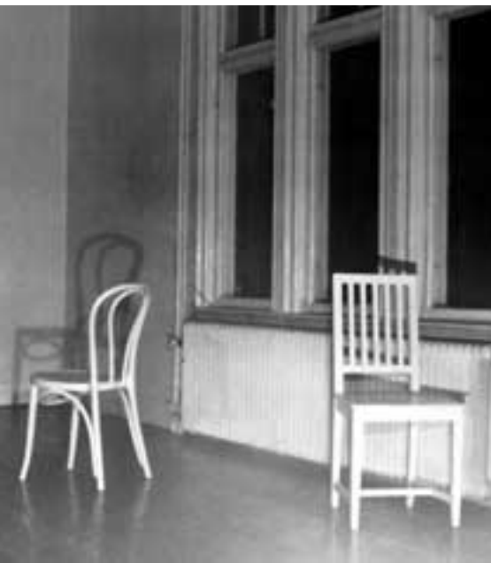
END OF STORY (DETALJ)