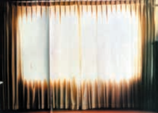
NOW YOU SEE IT, NOW YOU WON'T (1999)