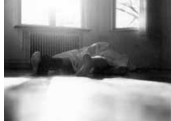
DET FÖRSTELNADE PARET