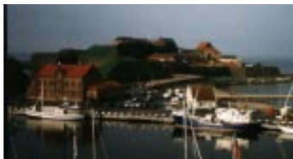
Varbergs fästning. Lite närmare än så här kom vi dock.

Väl framme vid dagens mål hade vår värd den goda smaken att välkomna oss med en sval öl innan vi tog en dusch.